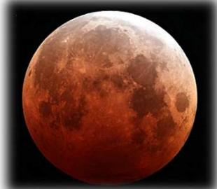
スーパームーン&皆既月食