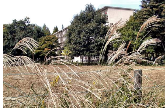
団地脇の枯れ尾花