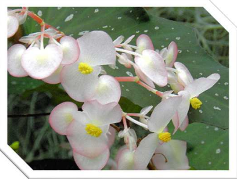
木立ベゴニア 濃い緑の葉が淡いベゴニアの花を浮かび上がらせています。