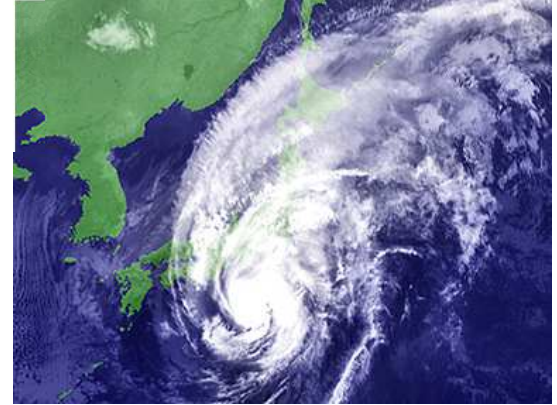
猛烈台風の襲来

ニュータウンでも“秋”を感じるさまざまな事柄を見ることができます。 皆さんも身の回りで“小さな秋”を見つけられたのではないのでしょうか。