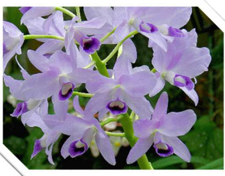
カトリア・ボウリングニアセルレア 薄紫色の花が集まって花嫁のブーケのようです。