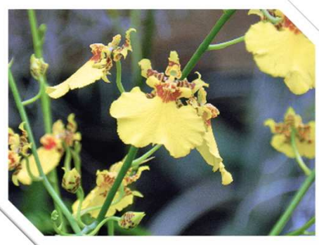
オンシジウム 黄色がキラリと際立っています。