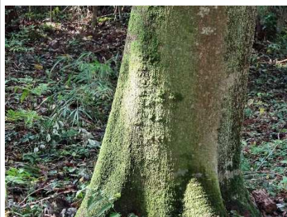
シラカシの幹に木漏れ日が射しています