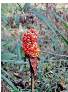
マムシグサの実が赤くなりました