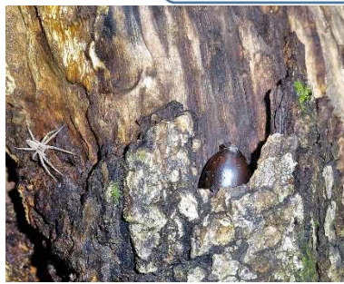
木の皮のポケットに落ちたどんぐり