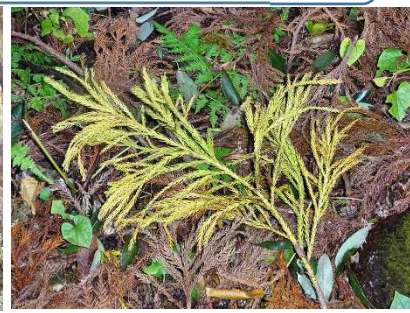
台風で落とされたのかまだ青い杉の枝。炎の形にも似てる