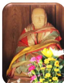
道野辺のお大師様