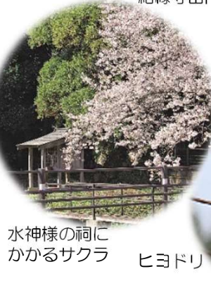
水神様の祠にかかるサクラ