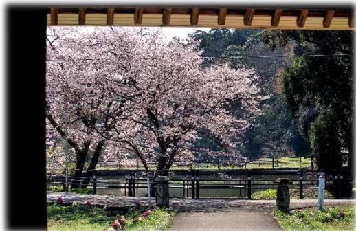
結縁寺山門から望む水神池

水神池の周りでは桜が咲き誇り、鳥たちがせわしなく蜜を探している。菜の花、フキノトウ、ヒヨドリ“チョットコイ”の声。夢のような春の一日でした。(3月23日)