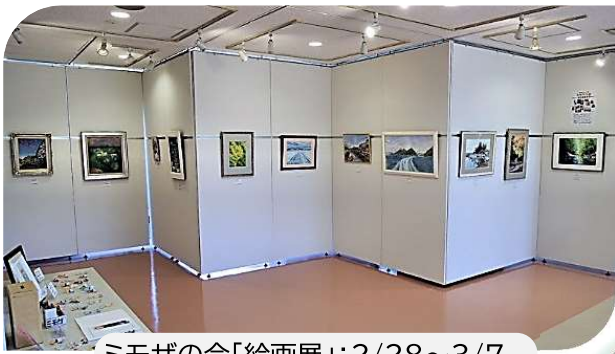
ミモザの会「絵画展」:2/28~3/7