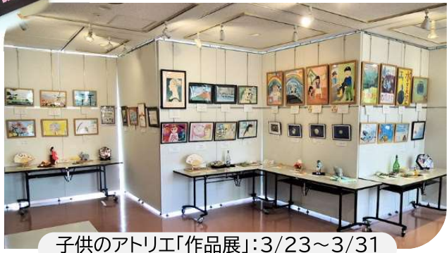
子供のアトリエ「作品展」:3/23~3/31

サザンプラザ・利用者団体の会加盟(4団体) ☆ギャラリー展示 ☆(2/28~3/31)