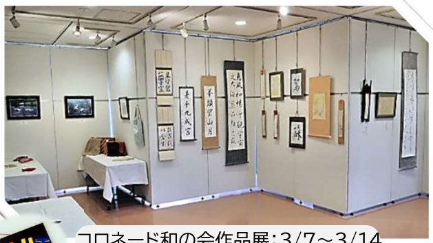
コロネード和の会作品展:3/7~3/14