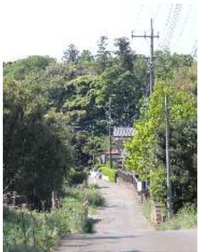
坂道を下って結縁寺へ

小さな子供を連れのお父さんや散歩のご夫婦、知り合いになった地元の方とおしゃべり。のどかな時間が過ぎていきます。