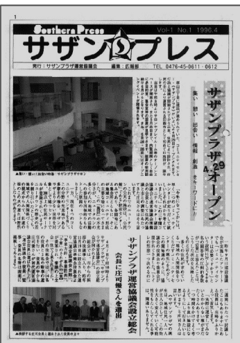
開館時のプレス表紙