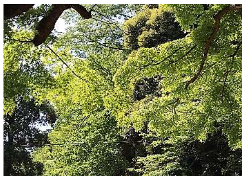
モミジの若緑が美しい