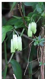
春の山野草：ホウチャクソウとガマズミ