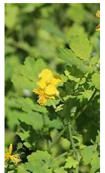
裏手にはクサノオウ