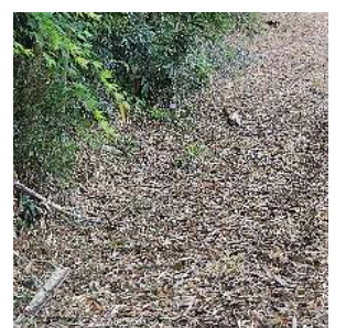
竹の春？ 竹の落ち葉がいっぱい