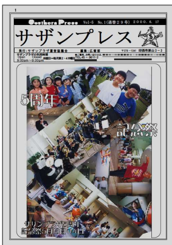
5周年を伝えるプレス紙(No.29号)