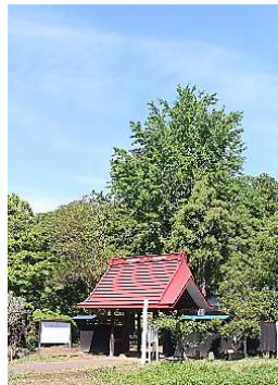
境内を歩いてみます