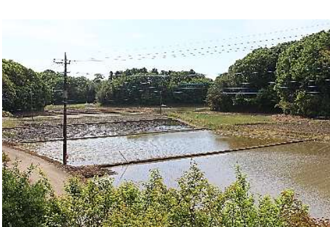
のどかな谷津田風景