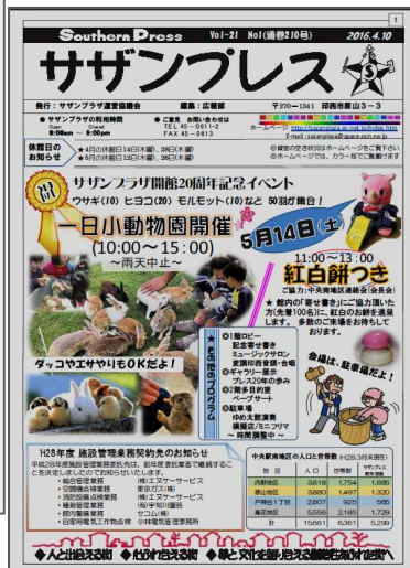
20周年記念の催し物を伝えるプレス紙(No.210号)