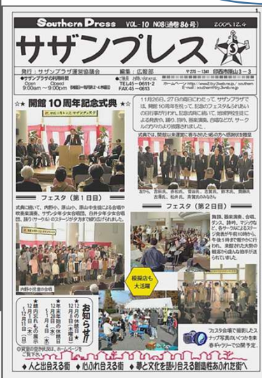
10周年の記念式典を伝えるプレス紙(No.86号)