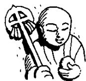
日差しに目を細める六地藏