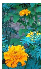
花壇の花が咲きました