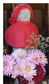
供えられた花も大きく