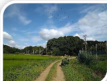
里山の道を歩いてみます