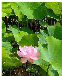
山門の脇では蓮の花が咲き始めている