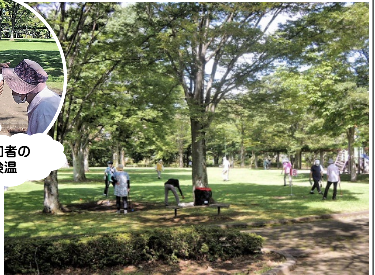
(多々羅田公園～木陰コース～)