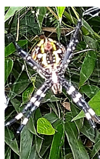
背中模様独特コガネグモ