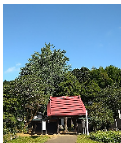
夏空の結縁寺山門

◆花の結縁寺がさらに花づくしになっていました。蝉時雨の中、今を盛りに咲く花々や、モミジの緑を見るのも…ゴクラク！ゴクラク！