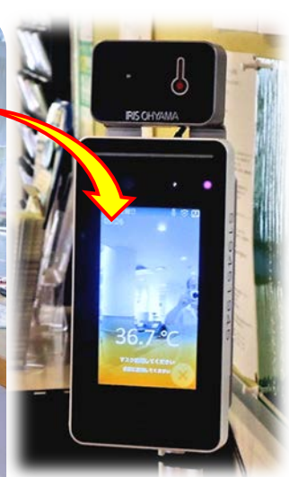
7/7設置。早速カメラに向かってポーズ？