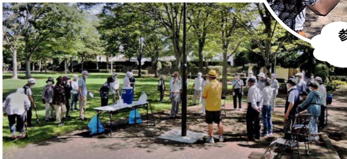
(暑さとコロナ対策について、スタート前のミーティング)