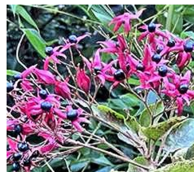
丘巻。森の宝石クサギ