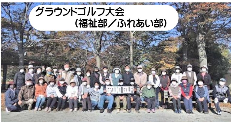
グラウンドゴルフ大会 (福祉部/ふれあい部)