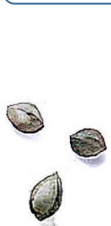
境内に落ち ている銀杏