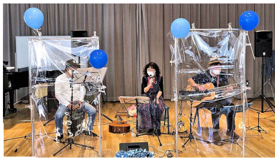
今年度よりサザンプラザ利用者団体の会に登録された「青い風船」のメンバー3人

◎ 緊急事態宣言も終了し、制限緩和されて来ましたので、今回は歌声喫茶初の“12月開催”。クリスマスソングをたっぷり歌います。