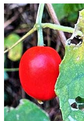
ムクノキ、エノコログサ、カラスウリ、ポップが止まらない