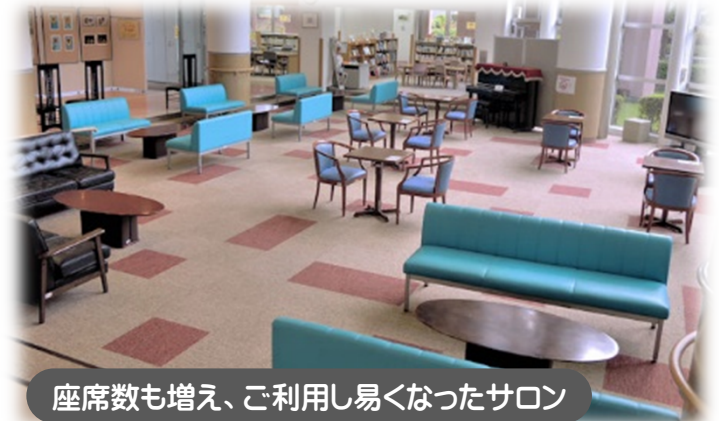
座席数も増え、ご利用し易くなったサロン