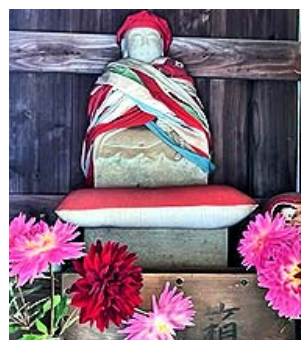
お大師様も花いっぱい