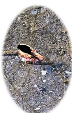
これは？ 睡蓮の芽でした