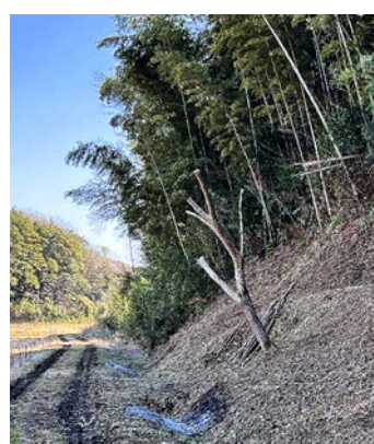
綺麗に手入れされた林縁の道