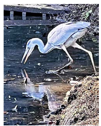
捕食直前のアオサギ