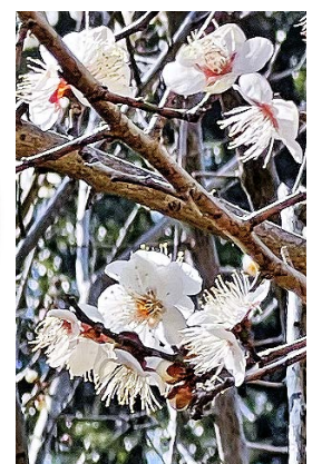
結縁寺境内の白梅