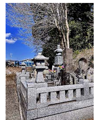
お帰りのさいと五輪塔