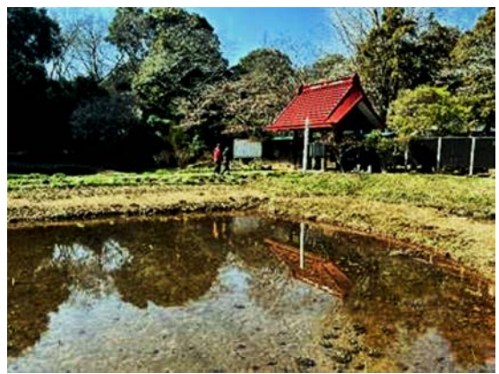
水温む結縁寺蓮池

あっという間に梅の花が咲き始めました。 逆光の白梅。遠くから見る満開の梅の木・・・眺めもいいですね。