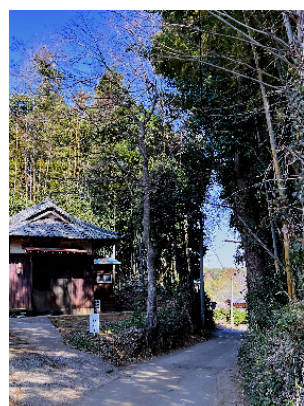
北風が駆け上る道