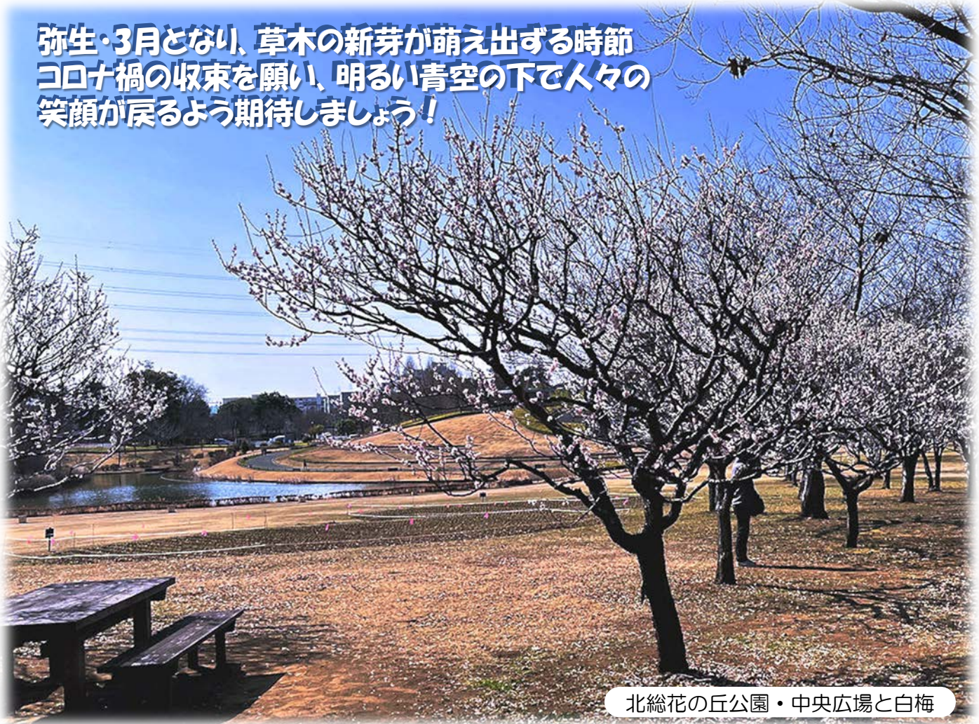
北総花の丘公園・中央広場と白梅

弥生・3月となり、草木の新芽が萌え出ずる時節 コロナ禍の収束を願い、明るい青空の下で人々の 笑顔が戻るよう期待しましょう！