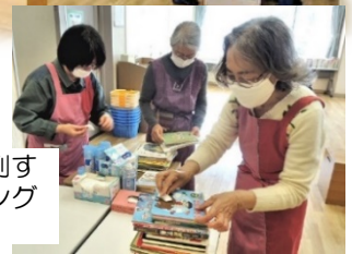
持ち込まれた本を、陳列する前に丁寧にクリーニングするスタッフ (写真右)