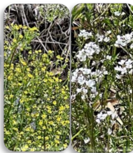
田んぼに咲く草花の群れ キツネノボタン・ナスナ