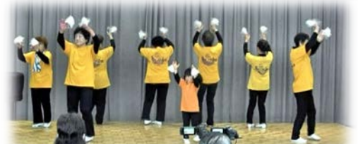
今回初めて参加された原山民踊サークル