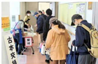
沢山の本を抱えて入場を待つ人々