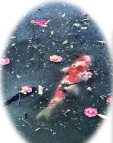
ツバキの花散る 水神池を鯉が ゆったり泳ぐ