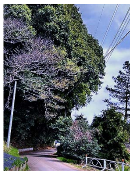
ウグイスが熱心に 鳴いている