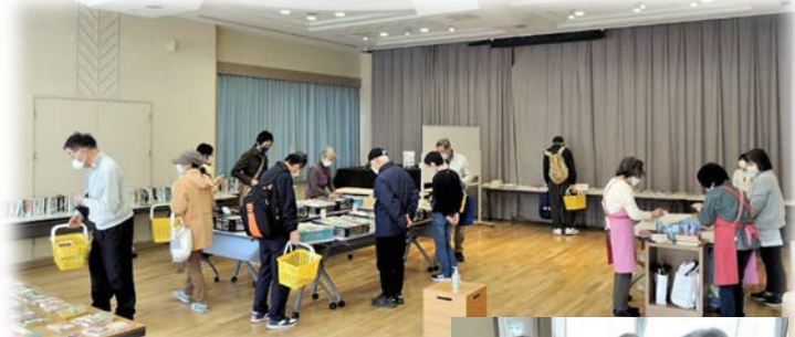
(写真上) 手指消毒材を配置し、制限された「同時入場者」は間隔を保って本を探す