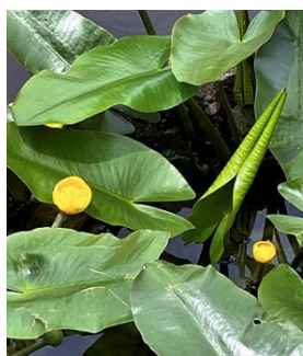
コウホネが一つ二つ咲き始めている

暖かい日差しに花や実・虫たちが一斉に動き出しました。次々と花を咲かせ実になり姿を変えます。早送りの動画を見るように。