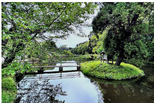
後ろから見た水神様 新緑が眩しい