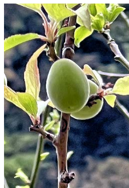
天神様の梅も大きく