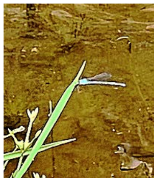
エメラルドグリーンのトンボ