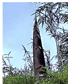
お墓の道に生えていた竹の子