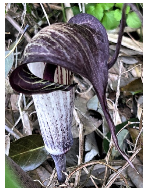
黒紫のウラシマソウ