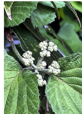
ガマズミのつぼみ