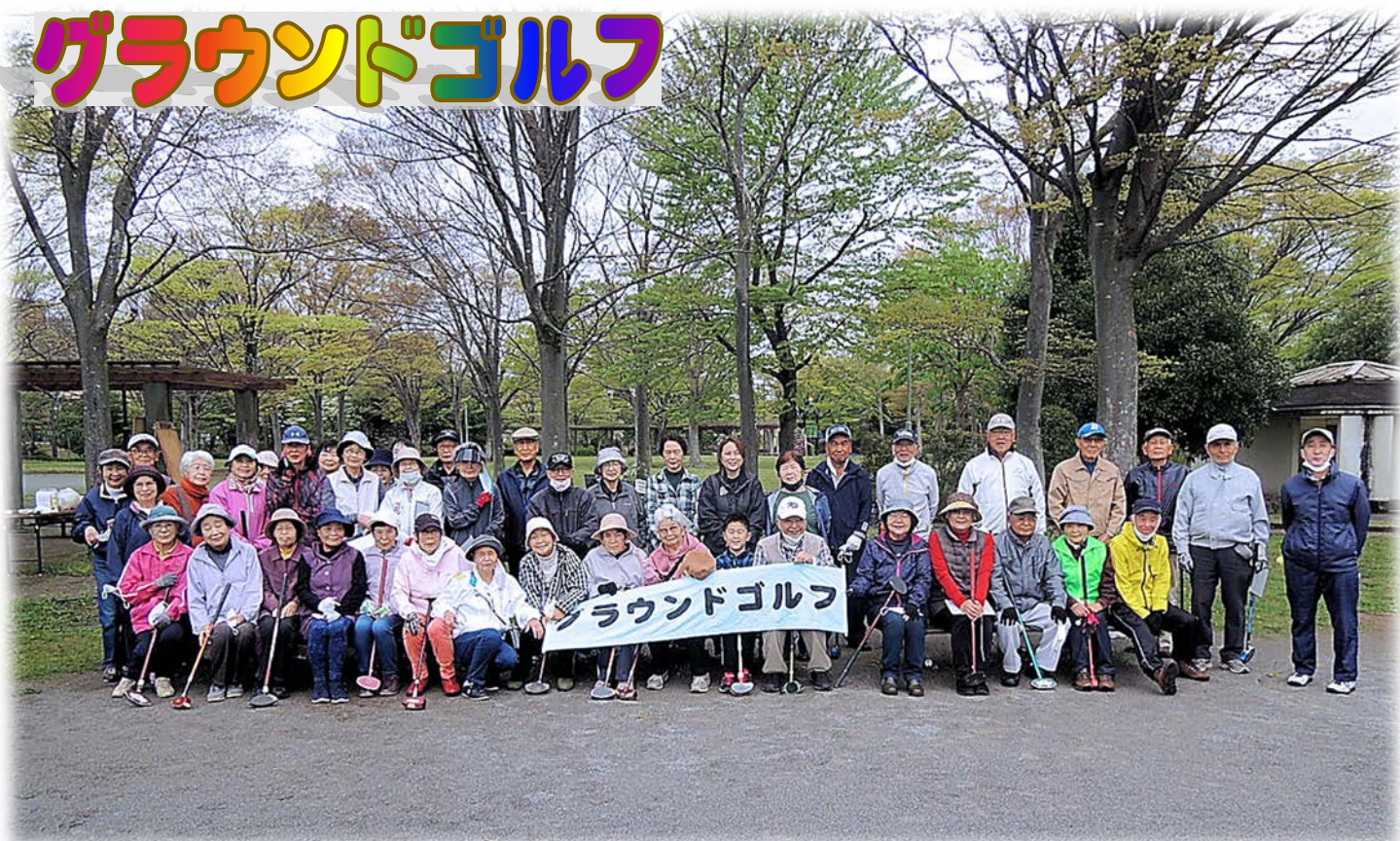
4月16日(土)多々羅田公園にて