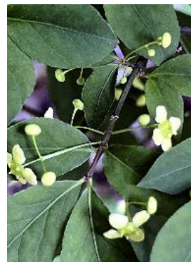
ニシキギの花は黄色