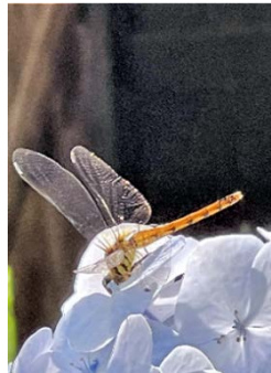
トンボも多く見かけた