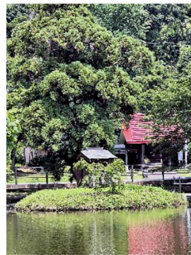
お帰りと水神様が云う