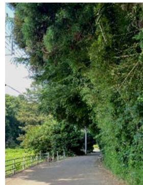
里山の道は木のトンネル