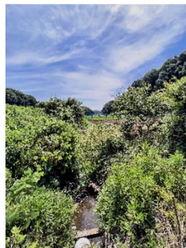
コボコボと流れる小川