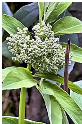
ニワトコのつぼみ