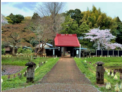
結縁寺山門を飾る満開の桜

満開を迎えた桜のもと、にぎやかな子供達の声が聞こえます。春休みなので遊びに来たようです。