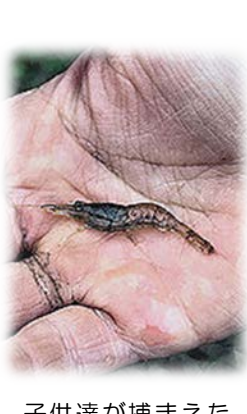
子供達が捕まえたザリガニ