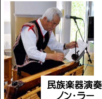
民族楽器演奏： ノ・ラー