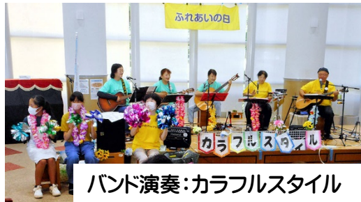
バンド演奏：カラフルスタイル