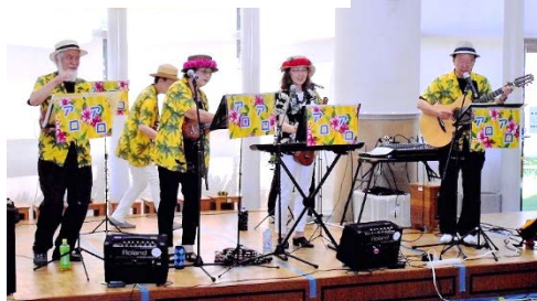
ウクレレ演奏：アロアロ