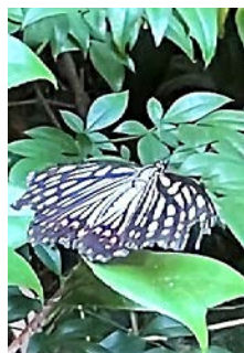
アカボシ ゴマダラチョウ