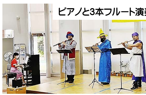
ピアノと3本フルート演奏