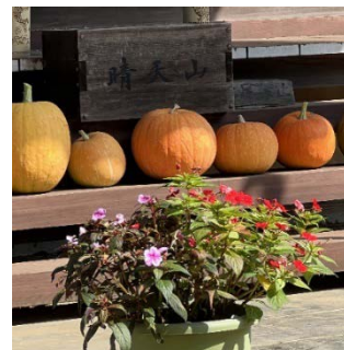
結縁寺本堂のお供物