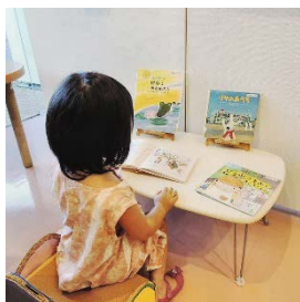
幼児向けコーナーに置かれた可愛い椅子で読書？

展示は8月7日に終了しましたが、引き続き「図書コーナー」で公開していますので、夏休み読書感想の参考にして頂けると幸いです。