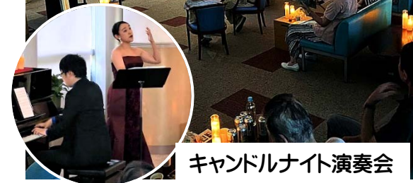
キャンドルナイト演奏会