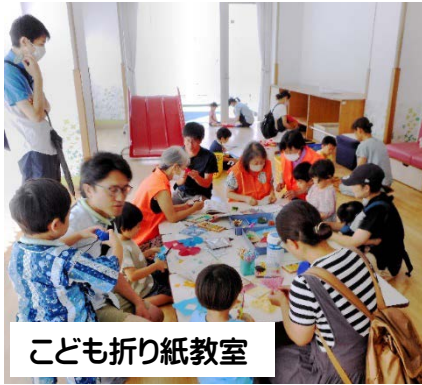
こども折り紙教室