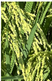
稲穂も膨らんで・・・