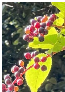
ウワミズザクラの実