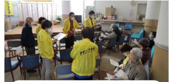
開演前の打合せ~利用者団体の会役員