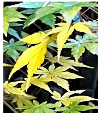
モミジの葉がバツと明るい