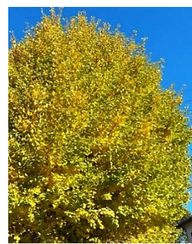
オオイチョウの黄葉