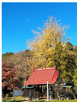
銀杏の横に月が見える