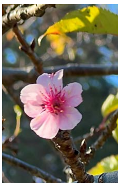
桜花がポツンと1輪