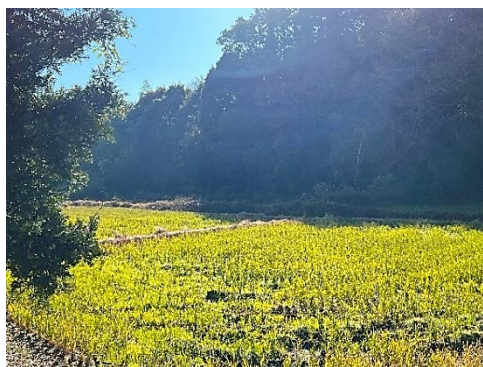
この谷津に住むモズがキキキッと鳴く