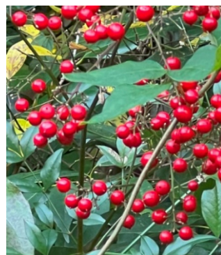
ナンテンもいよいよ赤く