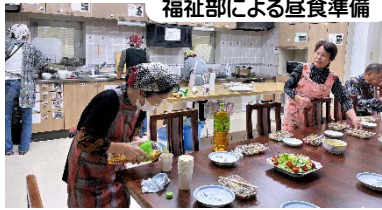
福祉部による昼食準備

1日目及び全般は、各部運営委員が率先して動いてくれるチームワーク。福祉部は委員への昼食サービス、図書部、文化部は受付や進行を担い、力仕事はふれあい部が担当。委員一同吹奏楽部の楽器運搬に軽トラ運転したり、広報やら音響やら影で動いてくれるボランティア精神豊かな人が集う、それがサザンプラザの運営協議会です。2日目も滞りなく実施できたのも担当の「利用者団体の会」の役員皆さんのおかげ。皆さんからの声は全館事業だけでなく、