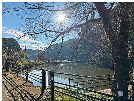
朝日が水神池を照らしている