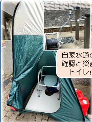
自家水道の点検確認と災害時用トイレ点検