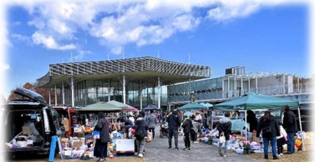
◎ 好天に恵まれ、多数のお店と大勢の入場者で賑わっていました。