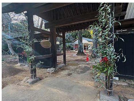
松と竹と南天の門松

令和6年お正月。多くの方が次から次へと初詣にこられます。門松もお供えのモチも賑々しく今日はハレの日。