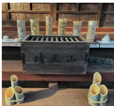
三二門松、竹灯籠、鏡餅。新米も少し