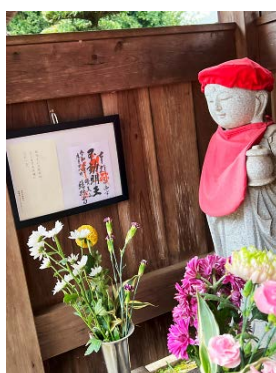
新しい額とお線香の香り