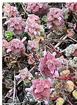
ヒメオドリコソウ