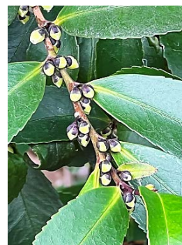
レモン色のヒサカキ