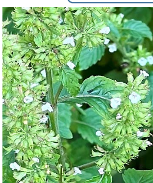
一面のイヌトウバナ