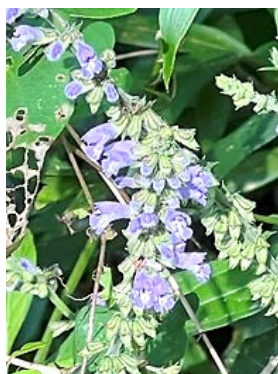
アキノタムラソウ