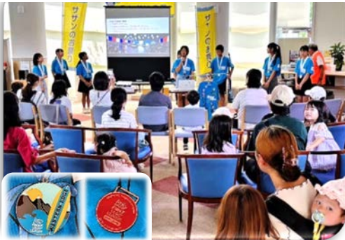
受賞メダル (左：全日本大会 右：世界大会)

8月4日(日) ~ 10時から16時 ~ 入場者数：400名余(スタッフ除く) ご来場ありがとうございました。