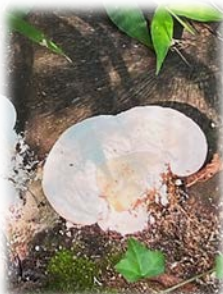
切り株に生えたキノコ