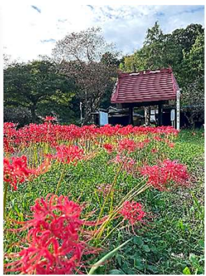
山門も彼岸花に囲まれて