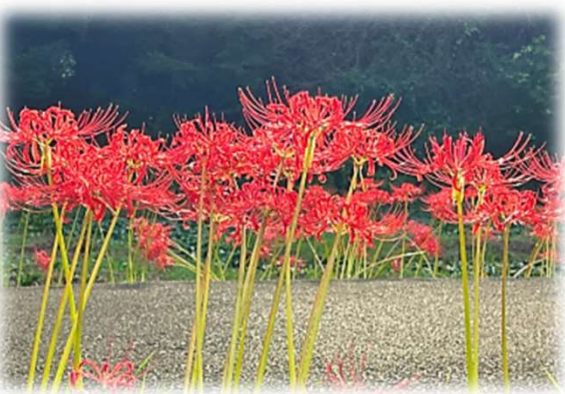
今日が彼岸花の盛りです

★ この時期には平日だろうと夕方だろうと人々の訪れが途切れません。花が遅かったのでさそかし気を揉んだことでしょう ★