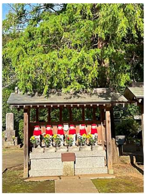
夕日に照らされる六地藏