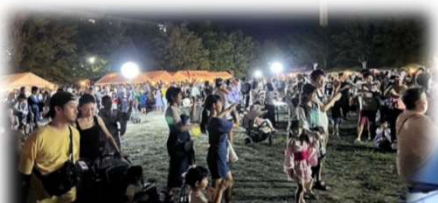
会場全体が盆踊りで賑わう