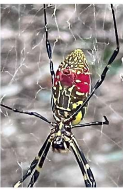
秋はジョロウグモ