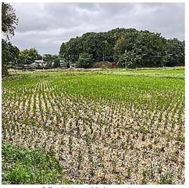
稲刈りの終わった田