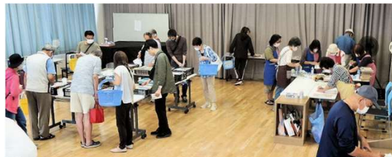
開場前、入場者が長蛇の列