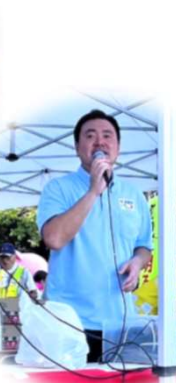
挨拶する藤代市長