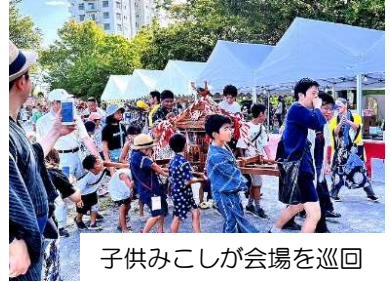
子供みこしが会場を巡回