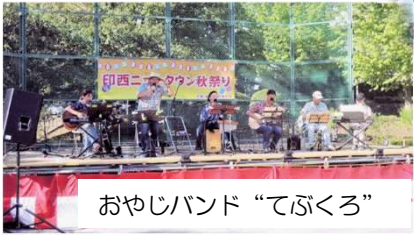
おやしバンド “てぶくろ”