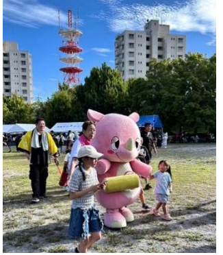
子供みこしに “いんザイ君” も参加