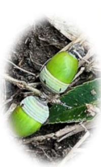
ドングリの実はまだ青い