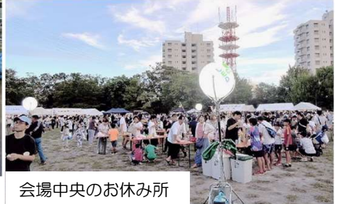
会場中央のお休み所