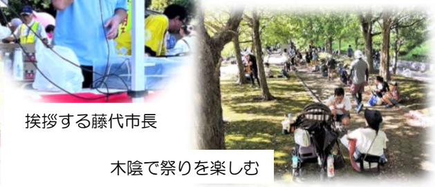
木陰で祭りを楽しむ