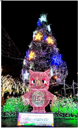
北口・ロータリー広場