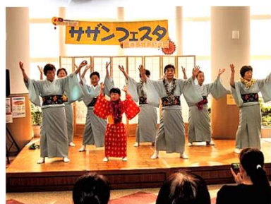
原山民踊サークル