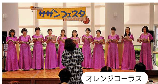
オレンジコーラス