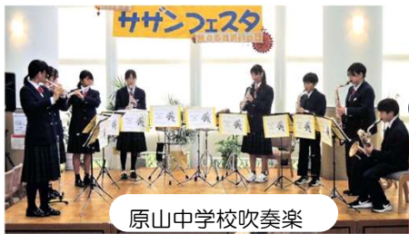
原山中学校吹奏楽