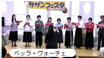
ベッラ・ヴォーチェ