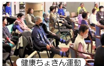
健康ちょきん運動