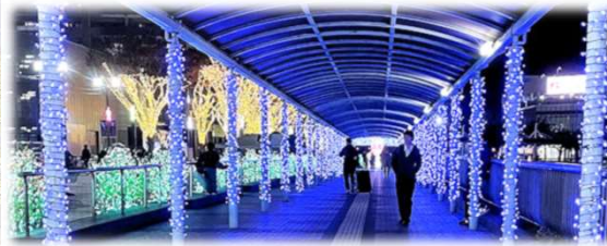
ブルーのイルミネーションで囲まれた 北口コンコース