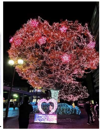
大木のイルミネーション(南口) →