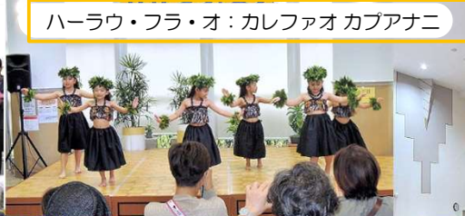
ハーラウ・フラ・オ：カレファオ カブアナニ