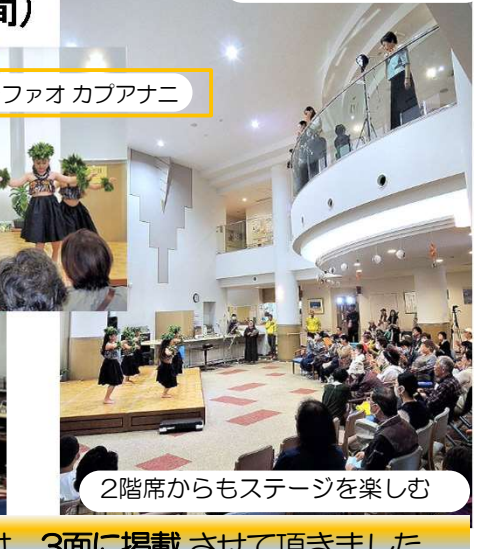
2階席からもステージを楽しむ