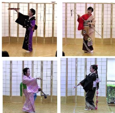
ひまわり会&あかね会