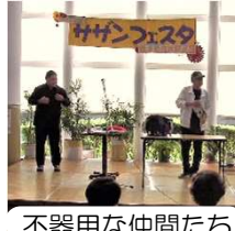
不器用な仲間たち