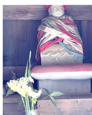
お大師様には水仙を