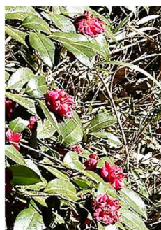
山茶花の赤がうれしい