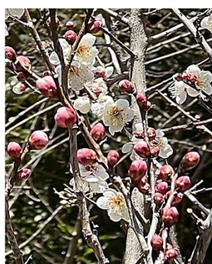
天神さんの梅もほころびかけて