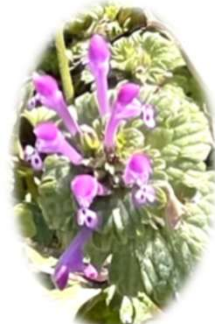
陽を浴びて花びら透けるホトケノザ