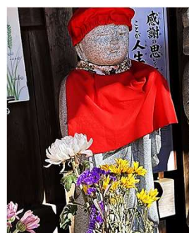
陽だまりのお地藏さん