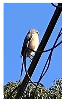
集落を見渡すモズ