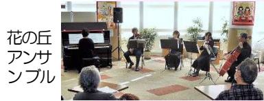
花の丘アンサンブル