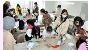
びっくりシール作り