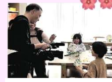
J-COM・TVのインタビューを受ける参加者