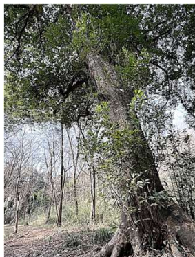
ひそやかな森の木々達