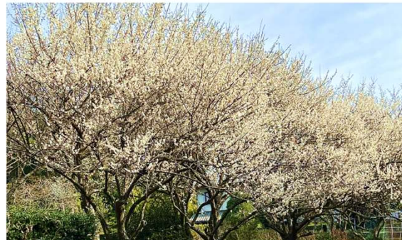
せわしなく小鳥たちが飛び交っている梅林