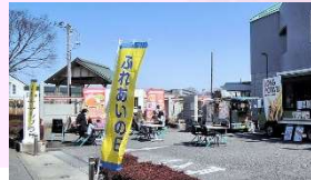
キッチンカー会場