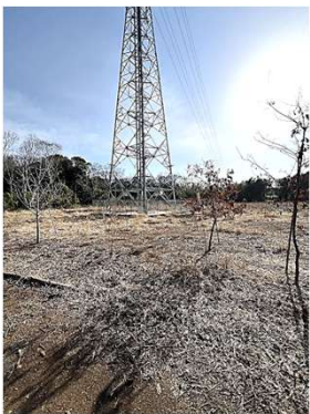
入口が広く開けていた

草深の森を抜けると隣接する家の梅林に出会える。ああこれが梅の香りかと思う。ずっとここにいて眺めていたい。