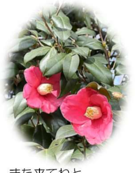
また来てねと、ツバキが見送ってる