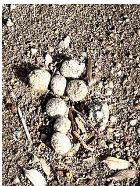
そこにはウサギの〇〇〇