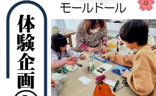
ラッコのカスタネット作り