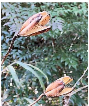
種を飛ばした後のヤマユリ