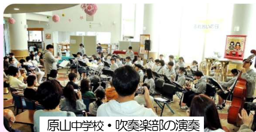
原山中学校・吹奏楽部の演奏